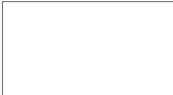
写真 3 (トイレの手すり 60×80cm)